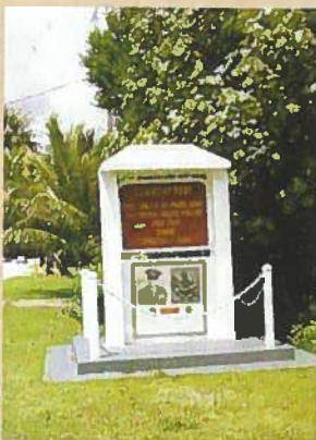
アガットの米軍司令部跡の 記念碑