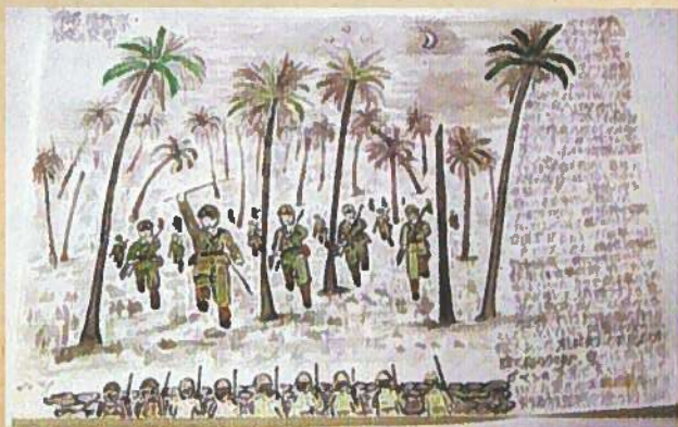
▲ 7月21日 米軍上陸: 仮設陣地の米軍に対し、夜襲をかける日本軍「戦争スケッチ」小林善一氏戦友作画(長野県)