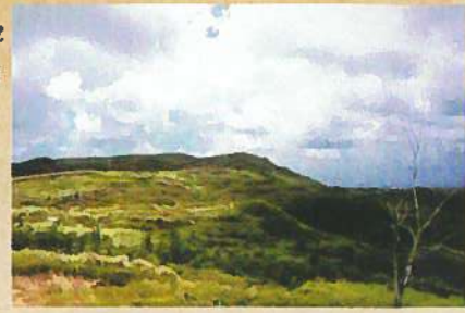
▲⑪Honte (本田台) 現在の激戦地跡 (2008年7月)