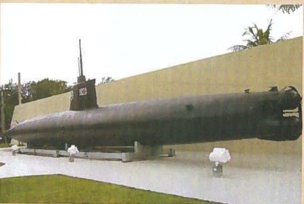
米海軍基地前の戦争歴史博物館前(日本の海軍特殊潜航艇)