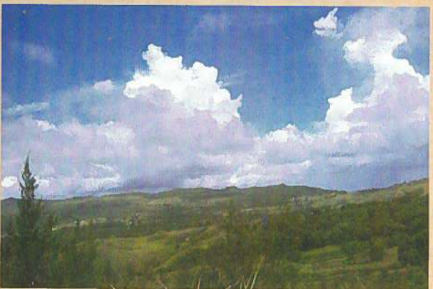
ニミツヒルよりアガット方面を望む