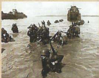
▲ 7月21日 上陸する米軍

日本の軍政下では、グアムを⑤大宮島と改名し⑥明石(アガナ: Agana)、⑦品川(シナハナ: Sinajana)、⑧稲田(イナラハン: Inarajan)など日本語の地名を付け、占領直後には、キリスト教聖職者をも残地させ、米兵や島民の死者への慰霊碑を建立し、本格的な軍政の実施に着手しました。