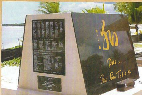
アガット(昭和町)慰霊碑