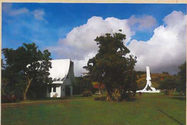
ジーゴ平和慰霊公苑 表紙: 慰霊塔