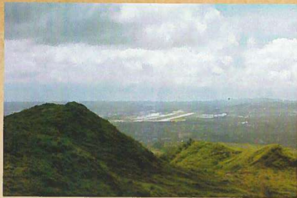
アルトム山(火の山)よりグアム国際空港を望む