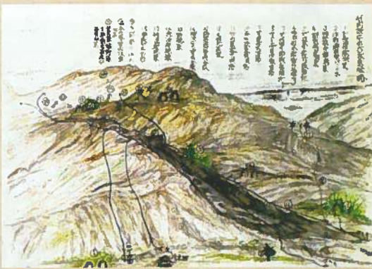
▲竹内隊本田台攻撃順路(作戦時)前村孝房氏(戦友)作画(山梨県)