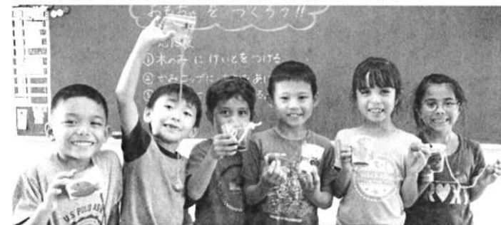
木の実のけんだま

先月、1年生は「あきがいっぱい」の学習をしました。秋には長期休暇がないため、日本の秋を実際に体験したことがない子どもも少なくありません。そこで、「秋にはどんなくだものがとれるかな?」「花やはっぱはどうなるかな?」と教科書や図鑑、写真を見ながら、日本の秋について調べて大きなポスターにまとめました。また、校内を散策、観察しながら拾った木の实や葉を使ったおもちゃ作りもしました。日本の自然を知ること、グアムにある自然を楽しむことのどちらも大切にしながら、豊かな心を育みたいのです。