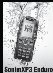
Sonim XP3 Enduro