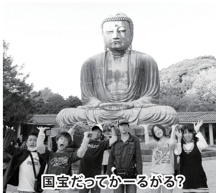
国宝だっけかーるがる?

修学旅行で見聞したことをこれからの学習で広げていくとともに、体験を心に刻み日本人としてのアイデンティティーを築いていってほしいものです。