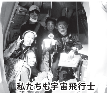
私たちが宇宙飛行士

宿泊は和風旅館に3泊、ホテルに1泊しました。見所たくさん、体験たくさんで学びっぱいの5日間を、寝食を共にし、スローガン「学び合い助け合い 日本で楽しいアルバム残そう 修学旅行2009」どおりの毎日を送ることができました。