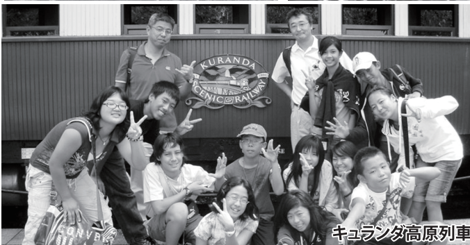
キュランダ高原列車