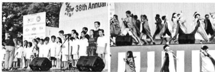
【↑昨年度秋祭り風景です。】

運動会でも披露したカッコいいソーラン節です。「どっこいしょ、どっこいしょ！」の元気なかけ声とともに、日本の伝統的な踊りを披露します。