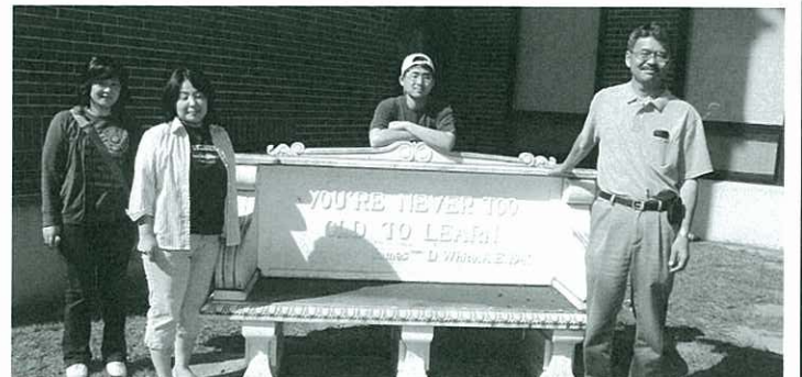
↑インディアナの大学にて。27年ぶりの訪問

いままでに過ごされた様々な土地での経験が現在に生きているのだと感じました。これからも暑いグアムで体調管理に気をつけてください。ありがとうございました。 インタビュー：森澤 健二