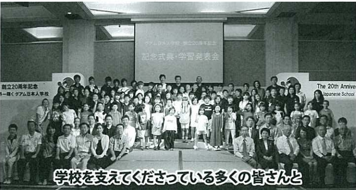
学校を支えて下さっている多くの皆さんと