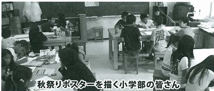
秋祭りポスターを描く小学部の皆さん

親は反対 でも二人の愛は止まらない 今、そしてずっと ふたりはいっしょにいる 二人は・・・ 気合を入れ、 長い髪を結び、 広い、青い海へ飛び込んだ 今、そしてずっと 二人はグアムを囲む海の中で ずっといっしょにいる 二人が飛び込んだ場所 みんなが知ってる 恋人岬