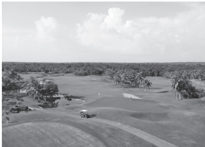
クラブハウスからの風景