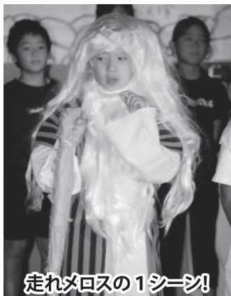
走れメロスの1シーン!

リーフホテルでの学習発表会の本番、僕たちが演じたのは、「走れメロス」です。たくさんのお客様が僕たちの舞台を見ているので、どきどきして心臓が飛び出しそうな感じでした。「間違えたらどうしよう…」というプレッシャーがかかりました。でも、「お客様の期待を裏切らないように頑張るぞ!」と思ったら、集中しでき、練習より上手にせりふも言えて、自分で驚くほど大きな声が出せました。他のみんなもしっかりとせりふを言っていました。終了して、先生が「今までの中で一番よかったよ！百点満点だ!」と言ってくれたので、とてもうれしかったです。来年度の学習発表会も頑張りたいです。