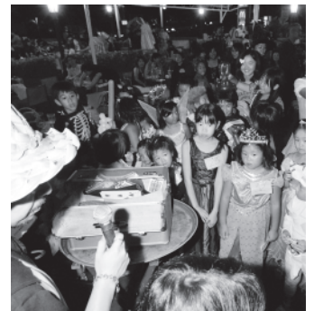
マジックショーの風景