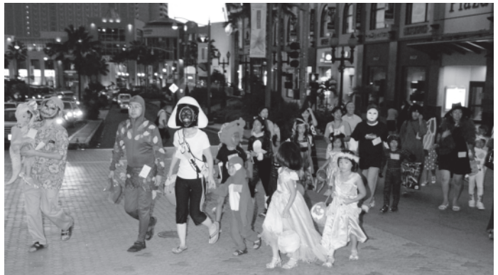
ハロウィーンパレード風景

自民党の麻生太郎首相が白洲次郎について好んで話す話がある。若かりし頃あるレストランで仲間と食事していると、家族ぐるみで親交のあった白洲氏が目の覚めるような美女と入ってきた。彼は麻生氏を認めると「この店も随分と客層が悪くなったもんだ」といい、食事もせずにそのまま出て行ってしまった。食後、麻生氏が会計をしようとする。「お代は白洲様より頂戴しております」と言われ白洲氏にご馳走になってしまった、と。