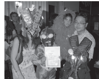
アリカヨスファミリー