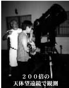
200倍の天体望遠鏡で観測

タモン地区から離れ、周りがゴルフ場で明かりに邪魔されず星がきれいに見えることから宿泊客へのサービスとして始めてから7年目になります。星がきれいに見える条件は周りが暗いことです。条件が良ければ肉眼で6等星まで確認でき、天の川もはっきり見ることができます。満月になると、見えるのは3等星まで、天の川は全く