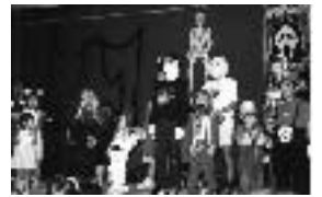
仮装コンテスト入賞者の皆さん