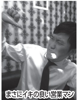
まさに伊の良い営業マン