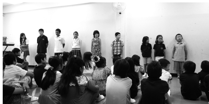
1学期終業式で「1学期を振り返って」について発表する児童生徒

夏休み、子どもたちはどのように過ごしたのでしょうか。本校の夏休みは日本国内の公立校の平均に比べてやや短いのですが、それでも普段経験できないいろいろな事が出来る期間です。各自の楽しい計画はしっかりと実施できたでしょうか。また、各担任からは、学年に応じた課題も出されていますが、仕上げる事は出来たでしょうか。充実した夏休みは、2学期の好スタートにもつながります。長い2学期を充実の期間にしたいものです。