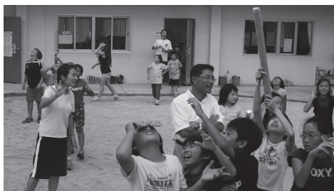
世紀の一瞬を見逃すな!

日本での次の皆既日食は26年後です。この子どもたちは、次の日食をどこで、どのような思いで見ることになるのでしょうか。