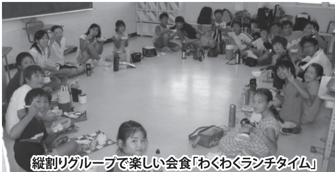
縦割リグループで楽しい会食「わくわくランチタイム」