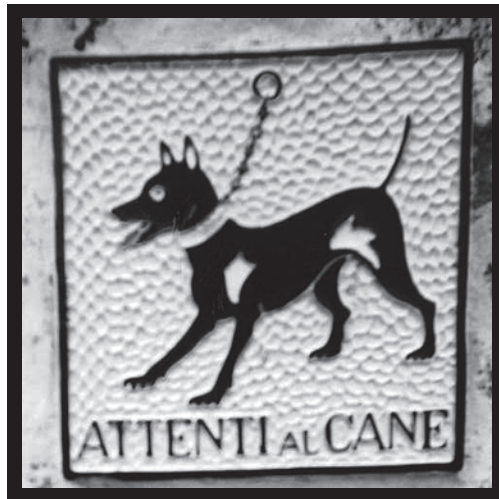
犬にも注意ですが、人にも注意です!!

1ヶ月かけて南イタリア方面を旅行しようとせっせと貯金をし、日程を決めて始めはナポリ、シシリー島、ソレントと夫婦バックパッカーの旅に出た、“イタリアは犯罪が多い”と気にしながら入国したが、イタリアの気候、人々の陽気さに警戒心が薄れていった。。。美味しいお料理、ワイン、美しい景色「アー、大満足！」と楽しんだ旅もシシリー島からローマに移動し、次の日のフライトの為ローマ・フミノチーノ空港の近くのアメ리카系のホテルに宿泊する事にしたのである。その日のホテルはたくさんの宿泊客、特に東洋人が多く、その時私は一瞬“気をつけよう。。。 ”と思ったのがその後の始まりである。早速ルームキーを貰い部屋に行き、移動の疲れを癒すため美味しいカプチーノを飲もうと1階にある、カフェ・バーに繰り出したのである。美味しいカプチーノ(本当に美味しかった。)を堪能し1時間後に部屋に戻り、鍵を開けたら。。。知らないマシュマロマンのようなイタリア男が私たちの目の前に現れた、「あら、部屋間違った？」と思ったのですが、チラッと見えた私のリュックが目にとまり「何やってるんですか!？」と問いただすと、この男「私はこのホテルのメンテナンスの係りです、窓の鍵の点検に来ましたチャオ。」とおろおろした口調で言いながら小走りで行ってしまいました。とっさの出来事に夫婦してポーとしてしまいました。キッチンとリュックサックの中に入れていた私のパスポートとトラベラーチェックが散乱しているのを発見し、“これは!しまった!”と急いで彼を追いかけましたが遅かった。。。急いでフロントデスクに行き、今あった出来事を説明しました、「ドアを開けたら、知らない男がいた、このホテルのセキュリティはどうなっているのだ!」と興奮して主人がフロント係の女性に言うと、彼女は一言、「さっきもあつたわ、今からセキュリティ係が来るから、彼をつれて部屋にあるあなたの荷物をもう一度点検してください。」私は係りのお兄さんを連れ部屋に向かう途中、この出来事を興奮しながら教えると、彼は眉をひそめ、“今日の君は本当、運がわるいね〜”といわんばかりの表情を見せた、そして部屋の中を見せ問題のリュックサックも確認したが、彼はただ見るだけ聞いただけだった。又フロントデスクに戻ると、フロントデスクの女性は、「本当に鍵を開けましたか？」などと疑うので主人は激怒して、「マネージャー呼んでくださいあなたに話してもらちがあかない。」すると彼女は、「今日はオフです。不安でしたらお部屋を変えますか?」でも部屋を変えても同じホテルの中なので又くる可能性があるわけで断ったのですが、その晩はホテル内のレストランで夕食を食べた時、周りに立っていたウェーターが皆、あのマシュマロ男に見え、楽しくなるはずのディナーが犯人探しの時間になってしまったのである。結果的には、怪我もなく、現金も取られていないので、無事でよかったね〜と夫婦でお互いをなだめあいました。 T.K.