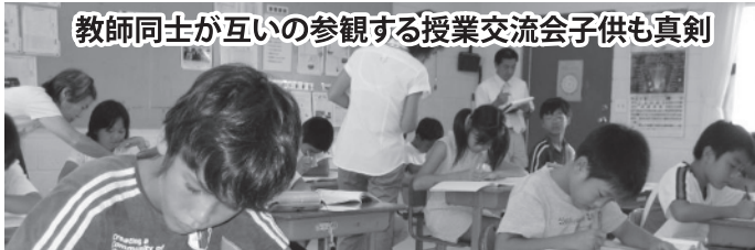
教師同士が互いの参観する授業交流会子供も真剣

でも、僕はあとになって、ちょっと変えてみました。それはアボガドを細かく切って、5、6個入れたのです。お母さんは「とてもおいしい。」と喜んでくれました。