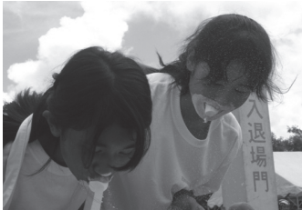
↑いつまでも友達だよ

教師からの厳しい叱咤激励、厳格な指導を受けて、この日本人学校を巣立っていく子どもたちは、それぞれの進学先で一層力を発揮できる勤勉さと粘り強い心を育てられているものと信じます。この熱い心を持った教師との出会いも学校の魅力でありたいものです。