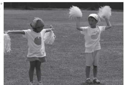
↑本やビデオを借りに訪れる人が 絶えない日本人会事務局