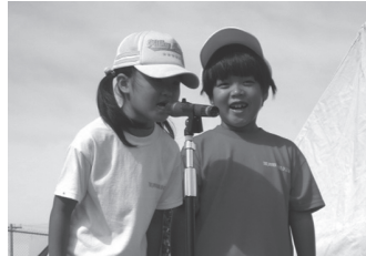
↑説明してみなさい

新聞で目にする日本の中心都市で起きた学力テスト問題は、過去の間違いの繰り返しです。この原因は、学校の役割を履き違え、いまだにテスト学力への信奉から抜け出せない大人たちの偏った学校観にあると思います。