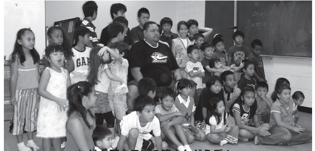
↑けん玉クラブの皆さんどうぞ！