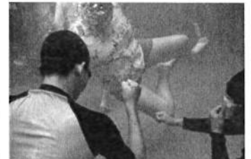
水慣れの「水中じゃんけん」