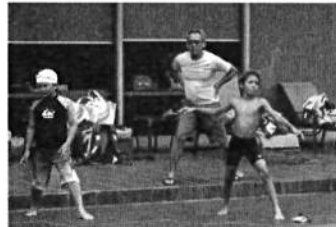
校長先生も一緒にプール指導をします。

上達してきたころにはタイムトライアルを実施するコースもあり、前回よりも「〇秒早くなった！！」と嬉しそうに報告してくれる児童生徒がいます。