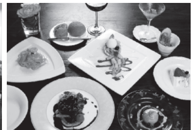
↑ メニューサンプル