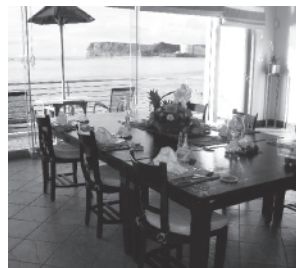
↑ ビーチフロントの会場

*ご質問、ご希望がありましたら遠慮なく、テ・キエロTEL:671-5111 松本までお電話下さい。