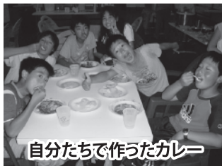
自分たちで作ったカレー

ぼくは、4月に日本からグアムにきました。日本の宿泊学習ではできない体験をいろいろすることができました。グアムに来てよかったなと思いました。とくに楽しかったのは、バンパーボートでした。むずかしかったのは、ウィンドサーフィンでした。みんなで作ったカレーライスはとってもおいしかったです。夜のキャンプファイヤーも思い出にのこっています。それから、水のこと勉強になりました。きたない水を少しも海にながしていませんでした。