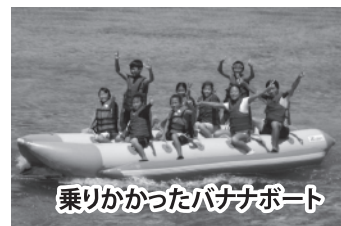
乗りかかったバナナボート