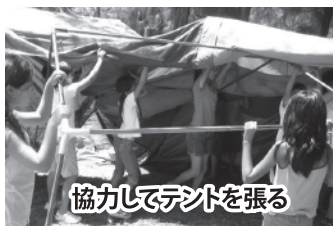
協力してテントを張る

ココス島のスタッフのみなさん、二日間ありがとうございました。そして、たくさんの思い出をありがとう、「ココス島！」。