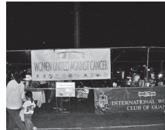
グアムウィメンズクラブの一員として参加