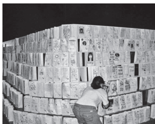
癌で亡くなった人への哀悼の意のキャンドル灯火