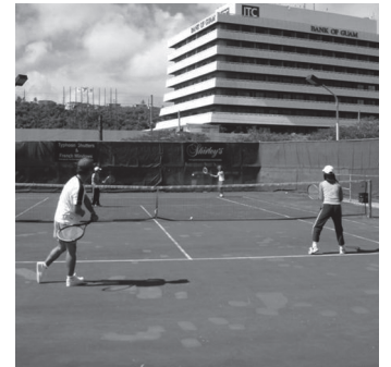
↑この日は若くて素敵なヤンママが多くゴルフより数倍楽しい屋下がりででした。