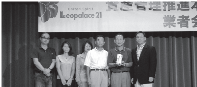
右より、大石管理部長、濱本教育部長、馬淵校長、岩嶋教頭、ダカナイ園長、石関補習校PTA会長