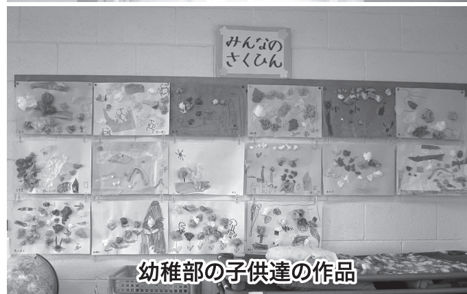
幼稚部の子供達の作品