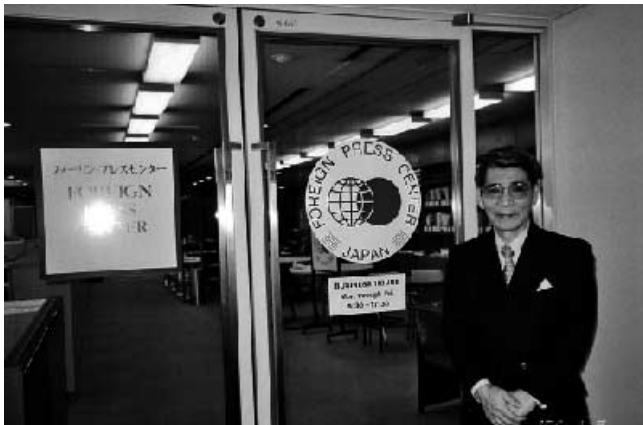
日本と海外をつなぐネットワーク (入山前総領事)