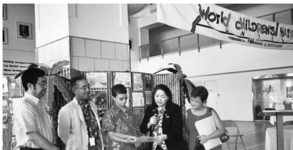
写真左より; 新任櫻井JAL支店長、松山前JAL支店長