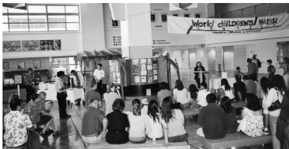
HAIKU展示会と表彰式 (JALオフィスロビー前)