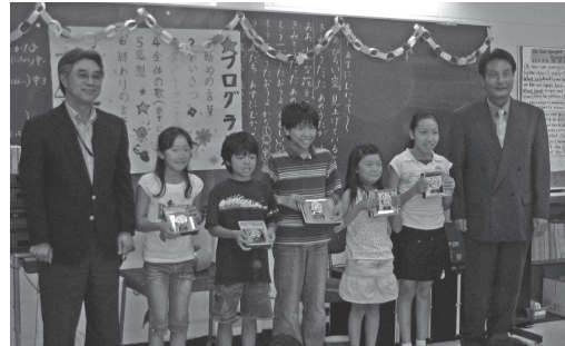
勝野支店長、入選した子供達、吉崎校長先生