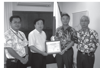
↑日本人会から総領事に感謝状を贈呈

途中体調を崩しながらも此処まで無事に勤務出来たことは皆様のご支援・ご協力によるものと深く感謝申し上げます。本当に有り難うございました。グアム日本人会の益々のご発展と皆様のご健康をお祈り致しております。