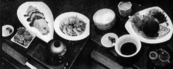
Japanese Style Omelet Served with Salad, Chicken Karaage and Miso Soup オムライス

$15 20% Discount for all PHR Club Members! A customary 10% service charge will be added