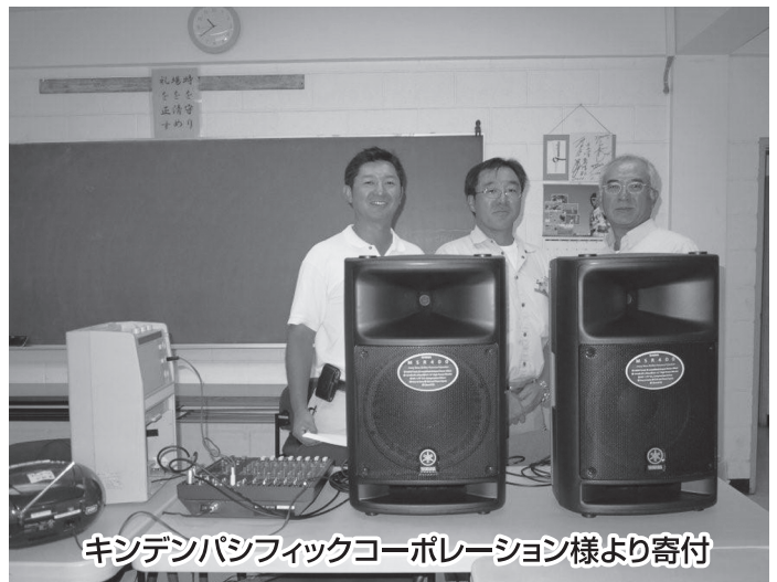
キнденパシフィックコーポレーション様より寄付

日本の学校暦は、世界の中では独特のものかもしれません。グアムの地では、多くの学校の新年度は8～9月に始まるようです。「長い夏休みを終えた後に、さあ新学年」ということなのでしょう。4月始まりでも9月始まりでも、新学年を迎えるときは新鮮な気分のはずです。素晴らしい新年度を迎えるためにも、この3学期を充実させたいものです。