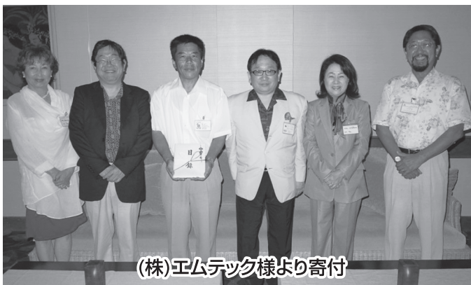
(株)エムテック様より寄付

このように、各方面の多くの皆様の様々なご支援によってグアム日本人学校が支えられていることに、改めて感謝いたします。