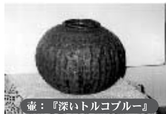
壺：『深いトルコブルー』