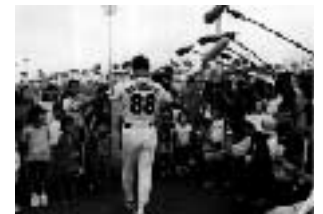
↑日本人学校の子供達と写真撮影