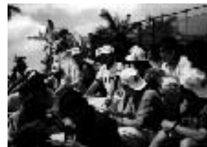
↑堀内新監督に群がるメディア