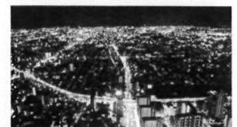
30日 大阪あべのハルカスの夜景