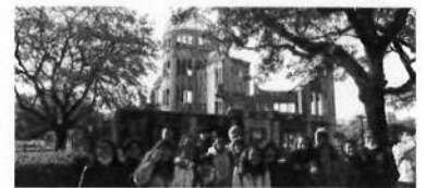
29日 原爆ドーム前で