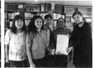
グアムサザン高校