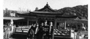
29日 宮島(広島県)にて