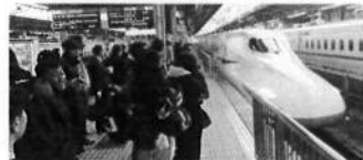
29日 新幹線で広島へ