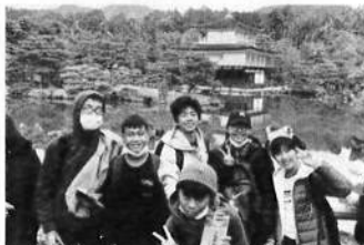
30日 京都 金閣寺