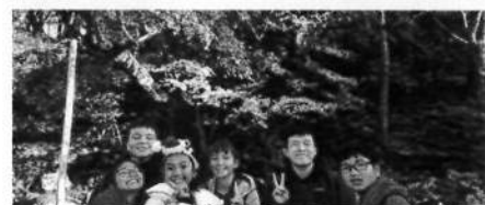
30日(月) 京都 紅葉を背に