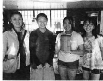
グアム日本人学校