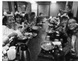
28日 夕食は「すき焼き」