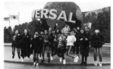
28日 Universal Studio Japan