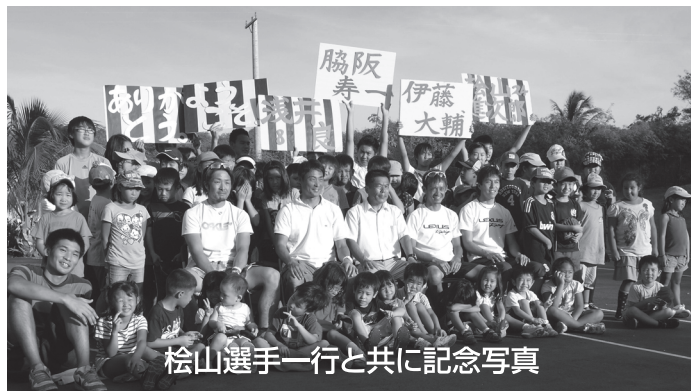
松山選手一行と共に記念写真