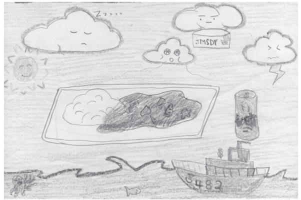
3年 ブラガ サラ