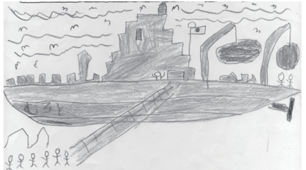
3年 山本 野英留