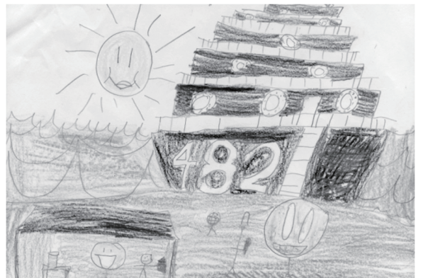
3年 マーゲス ケンジ