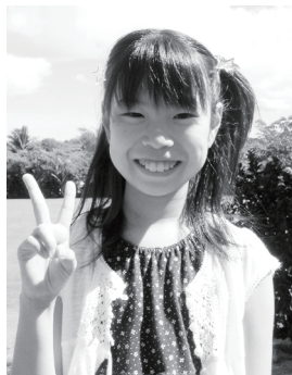
「忘れ物をなくしたい」

その後は踊りを見ました。すると、踊りのお姉さんが来て、わたしと一緒に踊ろうというように誘って来ました。なので、わたしはそのお姉さんと踊りました。最初はちょっと恥ずかしかったけど、踊っているうちに楽しくなってきました。