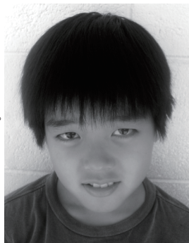
「てつぼうをがんばるよ」

昨日、ベンフランクリンでクリスマスツリーとわかざりと電気とソックスとサンタのバケツとテープのかざりを買いました。帰ってから、ツリーのかざりつけをしました。さいごに、電気をくるくるまきました。お父さんといっしょにわかざりを作りました。さいしょに作ったわかざりは小さかったけど、お父さんと作ったら大きいわかざりになりました。ばんごはんとケーキを食べました。ねむりました。そしたらサンタのゆめを見ました。今サンタさんは、何をするんだろうと思いました。朝おきたらプレゼントがありました。