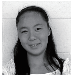
「勉強と水泳の両立」