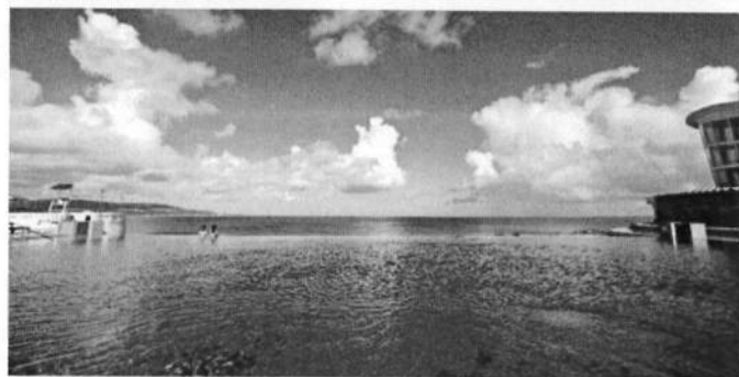
インフィニティプール