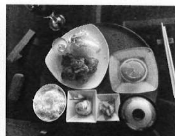
チキンから揚げ定食