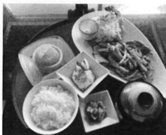
豚の生姜焼き定食