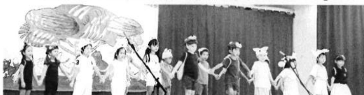
幼稚部 オペレッタ「リュックしょってピクニック」