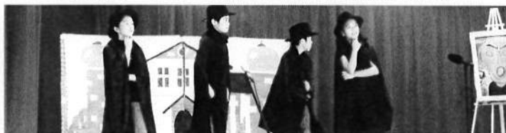
小学部5・6年 劇「ミス・パーフェクト」