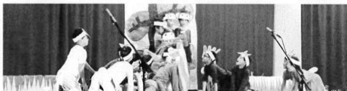
小学部1・2年 ミュージカル「赤いろうそく」