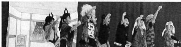
小学部3・4年生 劇「光～つなげたいモノ～」