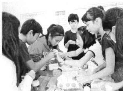
優勝クラス製作中