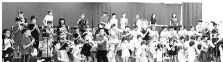
幼稚部・小学部 合奏唱「銀河鉄道999」