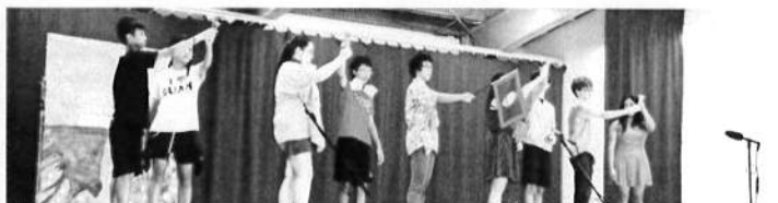
中学部 劇「True Lovers」