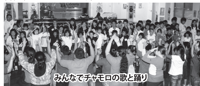
みんなでチャモロの歌と踊り

こちらからは一人10枚のしおりを用意して、自己紹介としおりに書いた好きな言葉（日本語）を英語で言えるように練習して臨みました。また、先生や生徒への英語での質問も用意して行ったこともあり有意義な1日となりました。帰りのバスの中では、「けっこう英語で話せたと思う。」「友達ができた。」「最初は不安だったけど行って良かった。」という言葉が口々に聞かれました。1月にはFDの生徒が本校に来ることになっています。