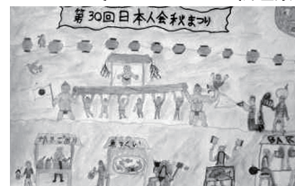
中1 ファミン 絵理菜