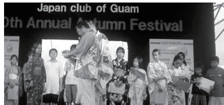
優秀ポスターの表彰式