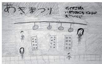
小1 サンガ・ティア