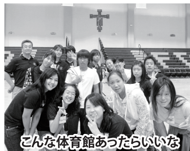
こんな体育館あったらいいな

中学部にとっては進路指導の一環とも考え、交流先を高校に求めました。その中で快く引き受けてくれたのが地元マンガラオにあるファーザーデュエナス高校（以下FD）でした。外国語教育として日本語クラスもあり、日本人の中学生や高校生との交流を考えていらっしゃったようで、双方の希望がうまく合いました。