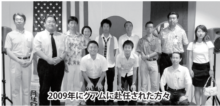
2009年にグアムに赴任された方々