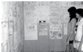
ポスター展示を見る人たち