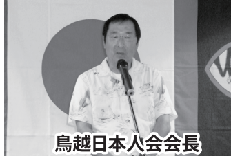
鳥越日本人会会長