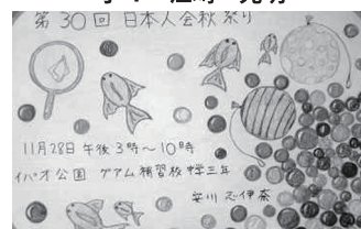
中3 安川 志伊奈