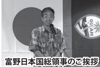
富野日本国総領事のご挨拶