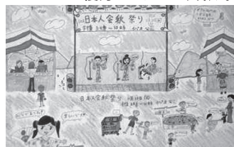
小3 ガイオス・シーナ 舞