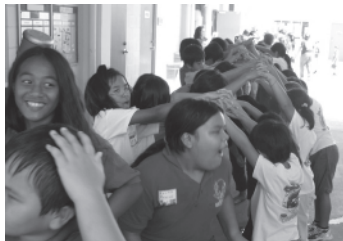
チャモロウィークに来てね