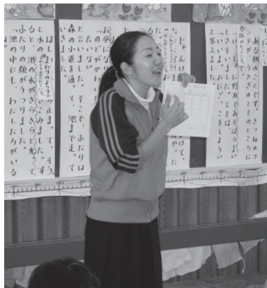
↑指導力を磨く研究授業