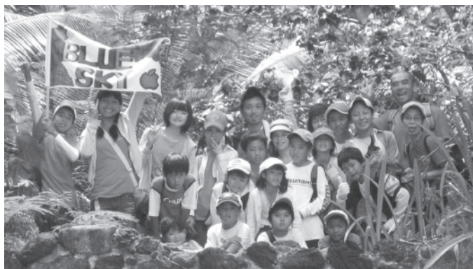
↑絆を深める全校遠足