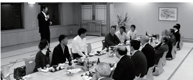
柏崎市観光協会主催レセプション