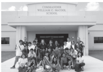
コマンダー中の皆さんと正門にて