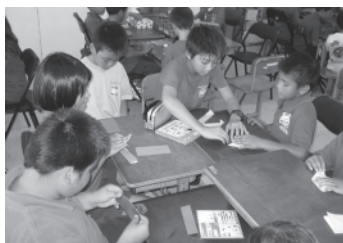
折り紙で何でも出来るんだ