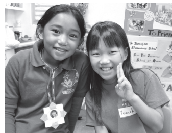
↑イナラハンの友達と!