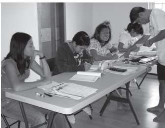
↑フルーツワールドでの勉強合宿